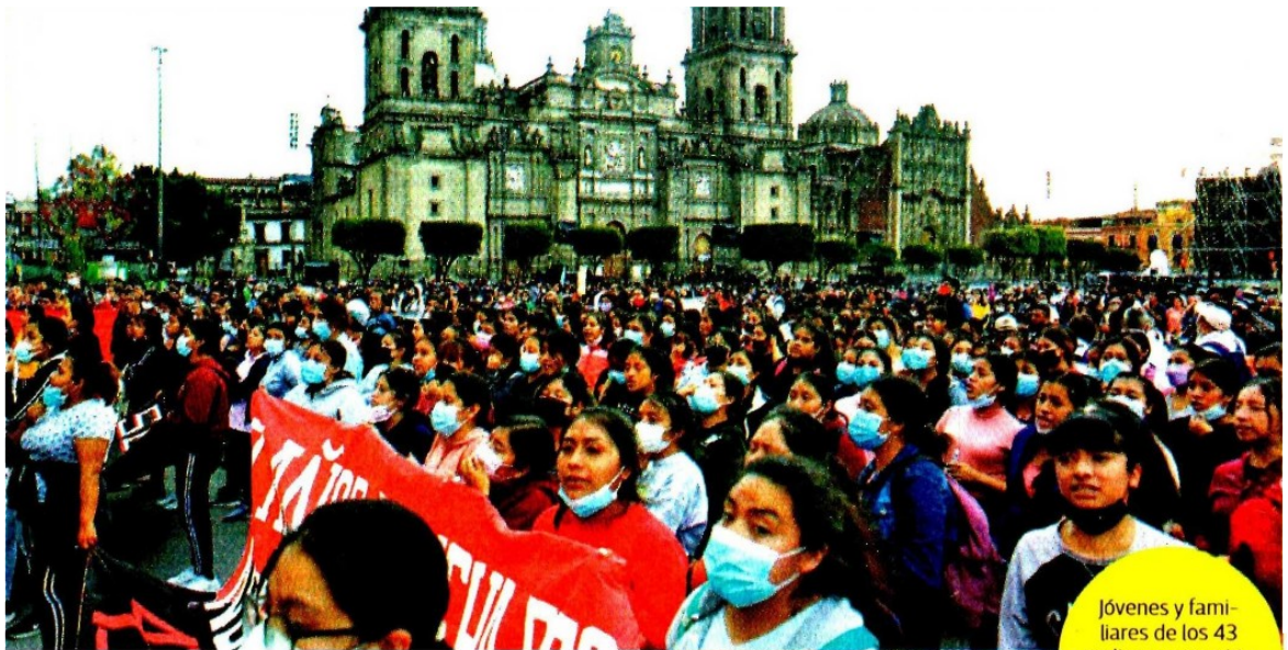
Jóvenes y familiares de los 43 realizaron un mitin ayer frente a Palacio Nacional.