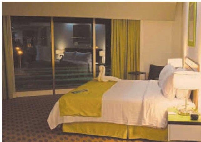
En el periodo del 2015 al 2019 el número de hoteles creció 56% en Querétaro, cerrando con 571 establecimientos en el 2019.

En septiembre hay una mejoría, llegando en promedio a 40% de ocupación en las primeras tres semanas y media, aunque los resultados de los días patrios no fue lo esperado por el sector.