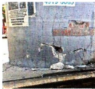
■ Ayer circularon imágenes de los daños en los pilares del Metro, tras los sismos del 2017.

Afirma que las fallas en la parte elevada ocurrieron después del sismo de 2017, bajo el Gobierno de Miguel Mancera.