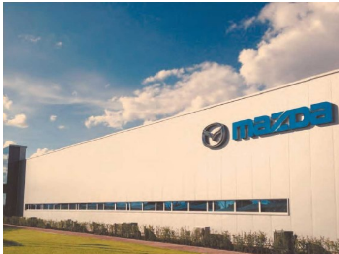
El Bajío y su industria estrella, la automotriz será una de las más perjudicadas por las alertas críticas para bajar el consumo de gas natural, ante la escasez de la molécula por el mal clima en Texas.