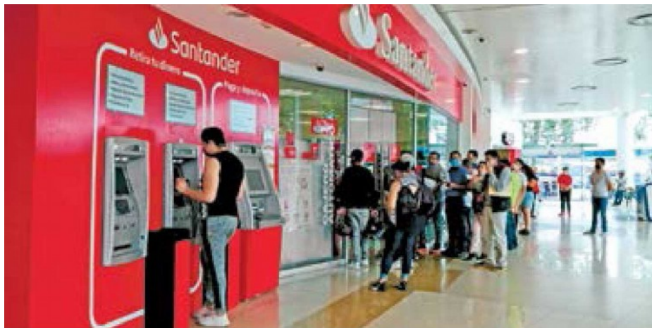
RETO. Las largas filas que se forman en los bancos son un foco rojo de contagios de Covid-19, debido a la dificultad para mantener la sana distancia.