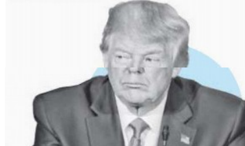
DONALD TRUMP Presidente de EU

“...ya es complicado el proceso que inician; no creo que quieran complicar otro tema (T-MEC)”