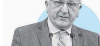
JESÚS SEADE Subsecretario de la SRE

“...ya es complicado el proceso que inician; no creo que quieran complicar otro tema (T-MEC)”