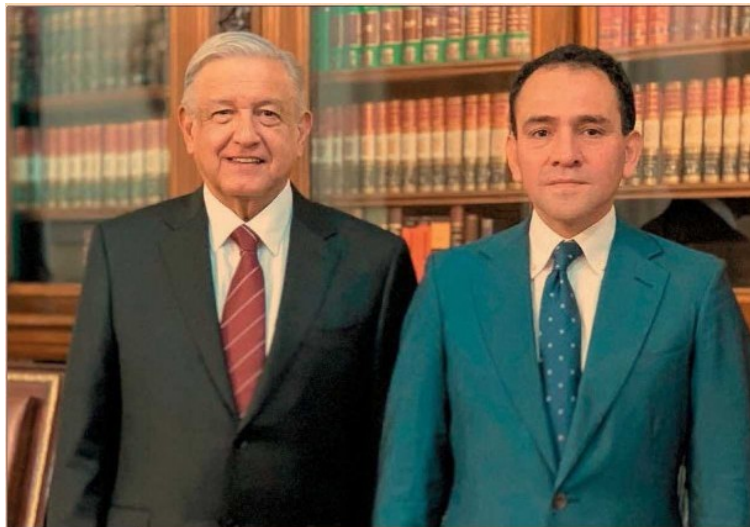
En un video transmitido en Facebook, Andrés Manuel López Obrador aceptó la renuncia de Urzúa e informó la designación de Arturo Herrera al frente de la SHCP