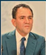
Arturo Herrera, secretario de Hacienda.

“Estoy muy confiado en el equipo hacendario y espero trabajar con ellos de manera coordinada”.