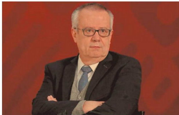
La salida del titular de la cartera de Hacienda generó volatilidad en el mercado. FOTO: REUTERS

FUENTE: BANXICO Y REUTERS. GRÁFICO EE: STAFF