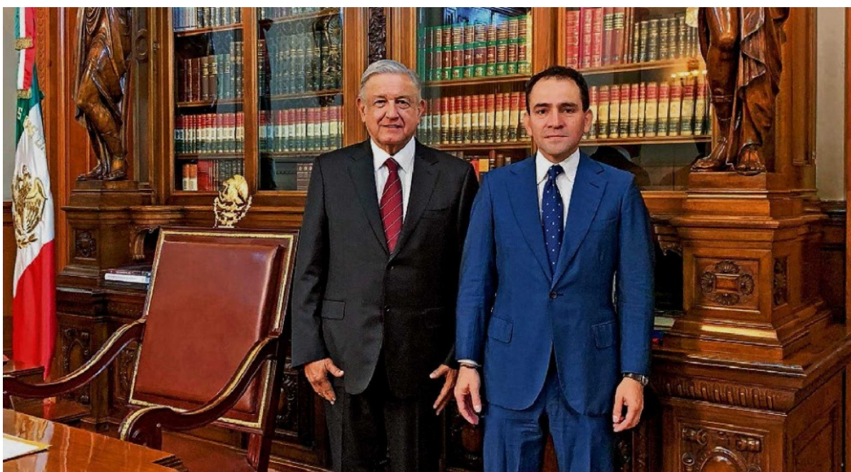
GOBIERNO DE MÉXICO